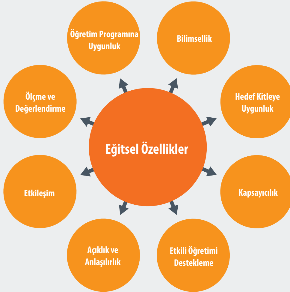
Şekil 2. E-içeriklerde bulunması gereken eğitsel özellikler

Eğitsel özellikler, e-içeriklerin geliştirilmesinde hem hedef kitlenin ilgi ve ihtiyaçlarına cevap vermek hem de öğrenme amaçlarına en etkili şekilde ulaşmak için dikkate alınması gereken özelliklerdir. Bu bölümde öğrenme kuramları ve iyi uygulamalardan yola çıkılarak, e-içeriklerin öğretim programına uygun olması, bilimsel standartlara dayandırılması, hedef kitleye uygun ve kapsayıcı olması, etkili öğretimi desteklemesi, açık ve anlaşılır olması, etkileşimli olması ve e-içeriklerde ölçme-değerlendirme uygulamaları gibi eğitsel özellikler ele alınmıştır (Şekil 2). Sıralanan eğitsel özellikler, kaliteli e-içerikler geliştirilmesine dolayısıyla etkili ve verimli bir öğrenme/öğretme deneyimi oluşmasına rehberlik edecektir.